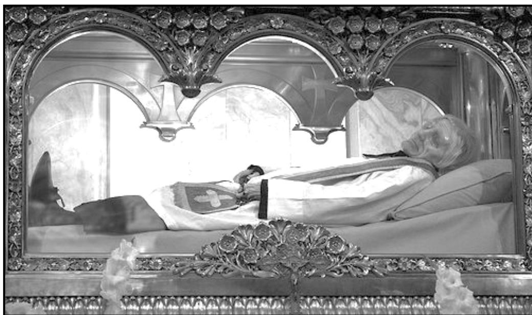
Der unversehrte Leichnam des hl. Pfarrers von Ars

O Mutter Jesu, durch deine unermesslichen Schmerzen beim Leiden und Sterben deines göttlichen Sohnes und um der bitteren Tränen willen, die du vergossen hast, bitte ich dich, opfere den heiligen, mit Wunden und Blut bedeckten Leib unseres göttlichen Erlösers in Vereinigung mit deinen Schmerzen und Tränen dem himmlischen Vater auf, zur Rettung der Seelen und um die Gnade zu erlangen... ( hier das persönliche Anliegen nennen ).